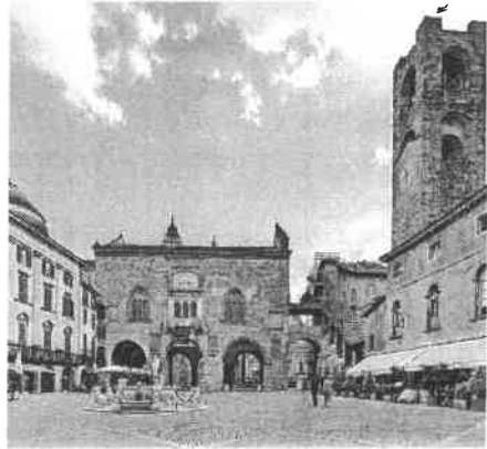
Città Alta, Bergamo

Momento principale è la sfilata, che si terrà domenica 9 maggio dal mattino fino alle ore 16, il cui percorso prevede di partire da piazza Sant'Anna e via Angelo Maj fino a viale Papa Giovanni XXII, dove saranno installate tribune