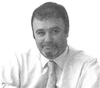
Il Sindaco Mauro Robba

Carissimi Alpini di Dongo, mi sembra davvero strano parlarvi in qualità di Sindaco, perchè mi sento, anzi, sono uno di Voi e così, mi permetto di scrivere queste poche considerazioni come se parlassi a me stesso e alla mia buona coscienza.