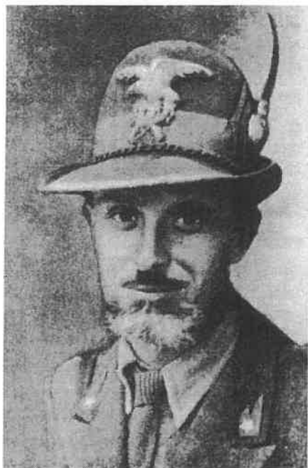
Foto storica di Don Carlo Gnocchi Alpino