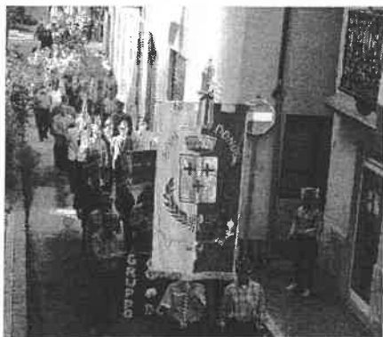
Sfilata lungo il paese

Parafrasando un celebre motto verrebbe da dire "85 anni e non sentirli" perchè il Gruppo che ho l'onore e il piacere di rappresentare da circa cinque anni, è più vivo e in forma che mai. Un piccolo drappello di giovani volontari entrato recentemente a far parte della "nostra famiglia", ha porta-