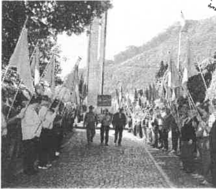
Corteo presso il Monumento ai Caduti

Quella di Domenica 20 settembre 2009 è stata una giornata memorabile per tutti noi Alpini di Dongo, che con una solenne cerimonia abbiamo festeggiato l'85° anniversario di fondazione del nostro Gruppo".