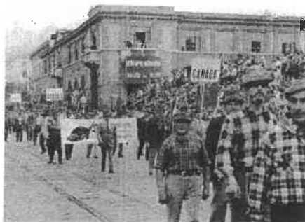
Foto storica della 59 esima Adunata Nazionale, Bergamo 1956

È da tempo operativa la segreteria del Comitato organizzatore dell'Adunata dell'anno prossimo a Bergamo. È aperta - in via Gasparini 30, 24125 Bergamo - da lunedì a venerdì, dalle 15 alle 18. Questi i recapiti: telefono 035.327010; fax. 035.4248745. L'indirizzo elettronico è 2010@anabg.it e il sito internet è: 2010.anabg.it .