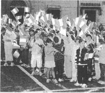
Bambini partecipanti alla manifestazione

25 anni e che tra l'altro è stato l'artefice della costruzione del nostro monumento, uno dei più belli e imponenti monumenti alpini d'Italia.