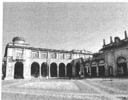
Piazza Vittorio Veneto, Bergamo